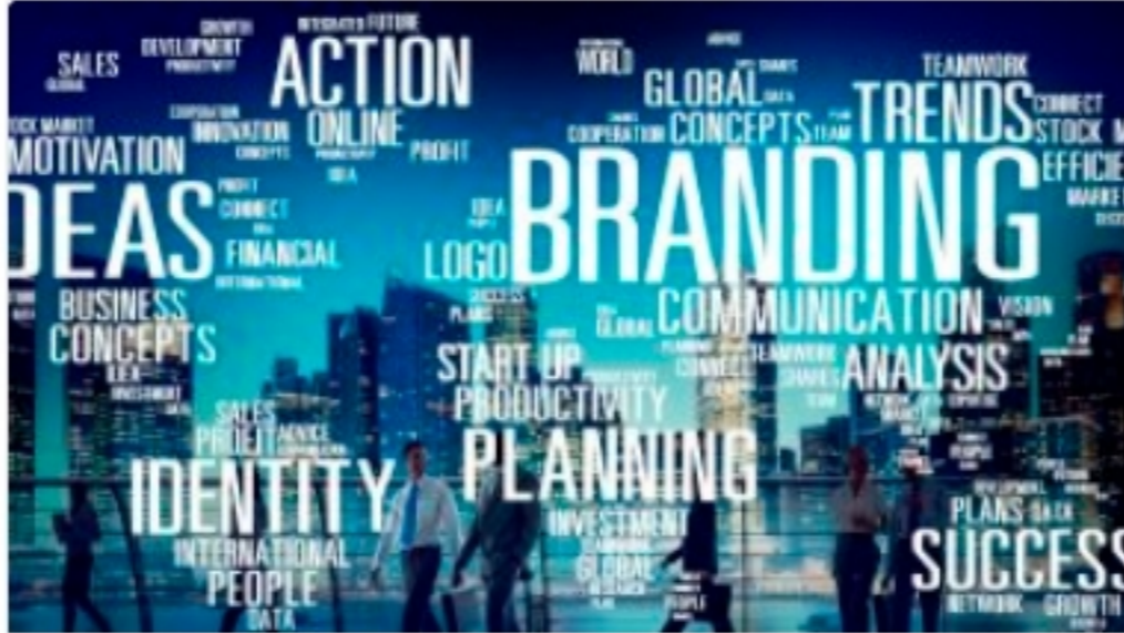
Programa de la Conversación sobre Publicidad y Relaciones Públicas