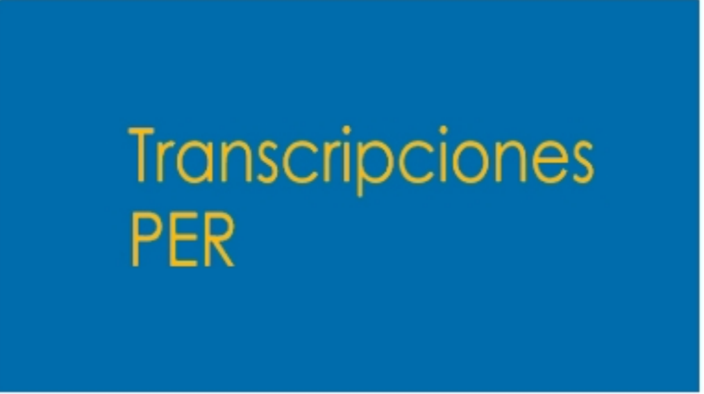
Transcripción de las sesiones de PER

Contenido generado con las grabaciones y transcripciones de las sesiones sobre Periodismo