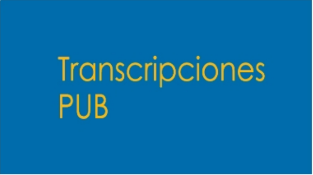
Transcripciones de las sesiones de PUB y RRPP

Contenido generado con las grabaciones y transcripciones de las sesiones sobre Publicidad y RRPP