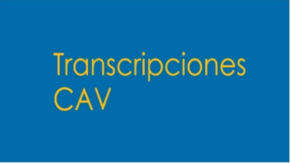
Transcripciones de las sesiones de CAV

Contenido generado con las grabaciones y transcripciones de las sesiones sobre Comunicación AV