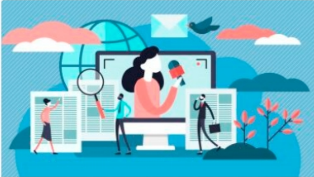
Programa de la Conversación sobre Periodismo