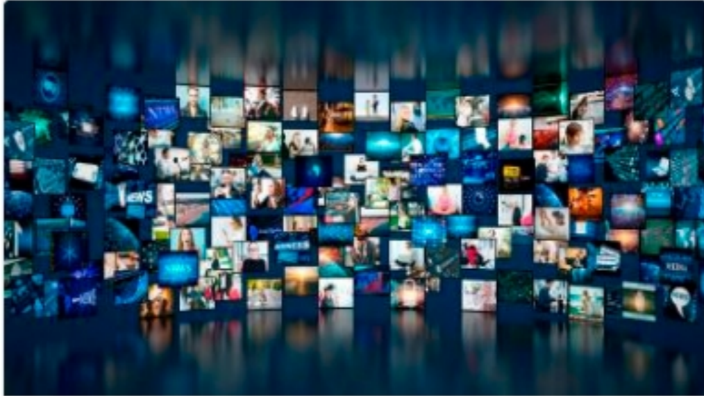
Programa de la Conversación sobre Comunicación Audiovisual